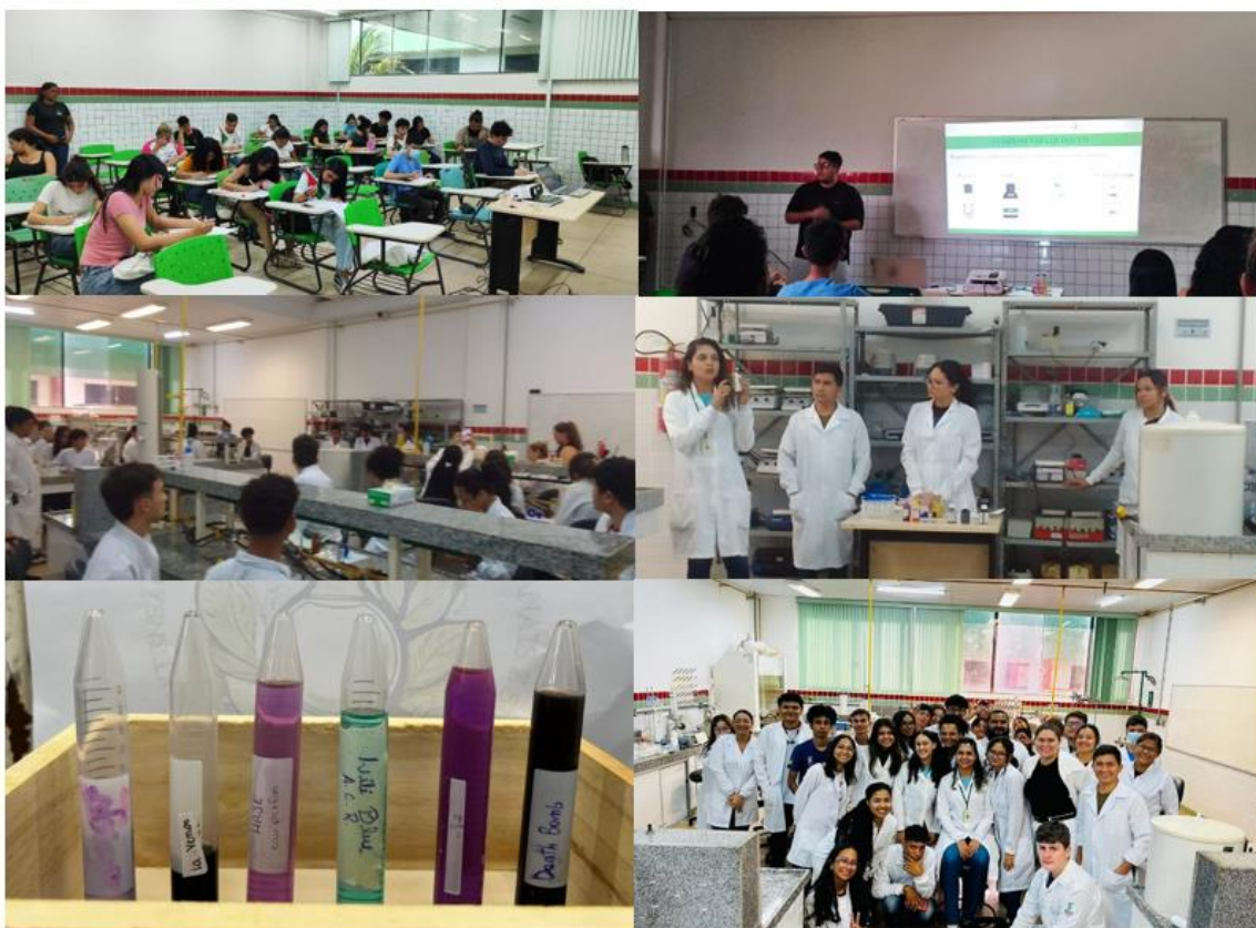
Figura 1- Aplicação da Oficina de Produção de Perfumes Artesanais e Sustentáveis

A avaliação da oficina foi realizada por meio de questionários de pré e pós, além de observações diretas. A análise dos dados utilizou uma abordagem descritiva, com categorização das respostas em termos relacionados aos componentes químicos, como "álcool de cereais", "essência", "fixador" e "glicerina". As unidades de medida e procedimentos seguiram o Sistema Internacional de Unidades (SI), garantindo a padronização na condução dos experimentos.