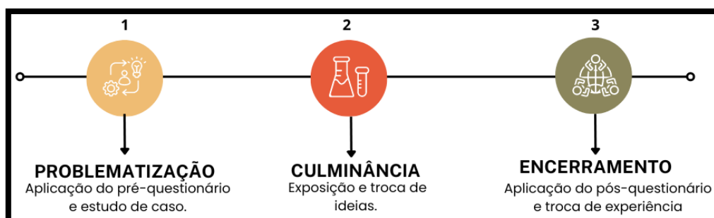
Imagem 1: Fases do projeto.

O trabalho foi construído a partir de uma análise qualitativa atrelada à observação participante (Laville E Dionne, 1999; Lüdke E André, 1986), com foco nos indivíduos em Âmbito educacional (Marconi e Lakatos, 2016) básico do Ensino fundamental 2, com coleta de dados a partir de questionários semiestruturados (Alves-Mazzotti E Gewandsznajder, 2002), pré e pós a culminância da feira científica. O projeto foi organizado em três momentos, como mostra a imagem abaixo: