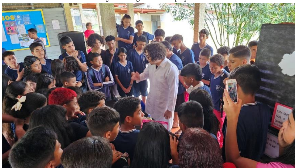
Imagem 2: Registros da Expoquímica

O segundo momento foi a realização da feira no dia 07 de maio de 2024, levando 16 experimentos para exposição, sendo eles: 1- Água Furiosa Glicose + NaOH + Azul de metileno, 2- Arco-Íris Químico pH e pOH / Ácido e Base, 3- Bomba de hidrogênio Célula Eletrolítica 4- Camaleão Químico Oxidação do Permanganato de Potássio pelo Hidróxido de Sódio 5- Cobreado Metais Ladrão de Elétrons Reação Não-Espontânea - Galvanoplastia 6- Cobreação Reação Espontânea - Reação do Bombril com Sulfato de Cobre 7- Coca-Cola Caseira Reação de Oxidação do Permanganato pela Água Oxigenada 8-Fogo Mágico Oxidação da Glicerina pelo Permanganato 9-Galão de Combustível Combustão do Etanol 10- Leite Psicodélico Densidade de Líquidos 11- Luz de Bohr Salto Quântico – Modelo de Bohr 12-Revelação de Digitais Reação Orgânica de Iodação 13- SaLuz Ionização + Dissociação Ligações Químicas 14-Sangue do Diabo Indicador Ácido-Base + Amônia 15-Sangue Falso Reação de Produção de Tiocianato de Ferro 16- Sopro Mágico Indicadores Ácido e Base 17- Violeta que desaparece Oxidação do Permanganato de Potássio pela Vitamina C ou Água Oxigenada.