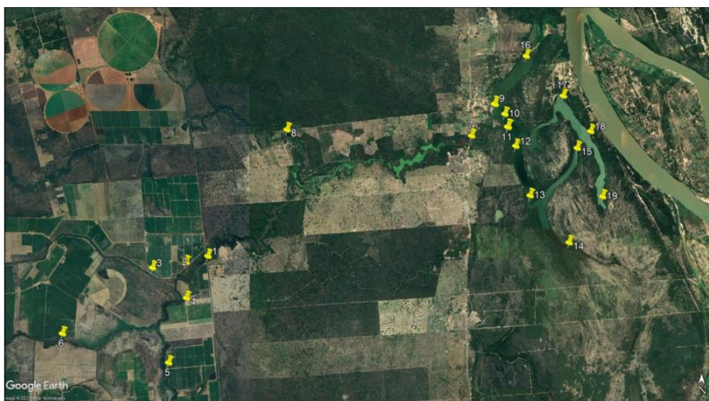
Figura 2: Distribuição dos pontos de coleta

Para a realização das análises, inicialmente filtrou-se 15mL de alíquota em filtro de seringa Millex de celulose regenerada com 13 mm de diâmetro e 0,22 µm de poro. Após a filtração, adicionou-se 750 µL de uma solução contendo Hexano e Tolueno na proporção 7:3 e submetida a agitação magnética por 30 minutos, em seguida foi coletado 600 µL do sobrenadante e colocado em frasco âmbar para secar em banho maria, concluído o processo de secagem, foi ressuspensa 200 µL da amostra em hexano: tolueno (7:3) e transferida para o insert dentro do vial de 2 mL.